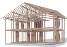
CLTハイブリッド構法

CLTハイブリッド構法では、CLTを使うことでCLTパネル工法の強く開放的なメリットはそのままに、在来軸組構法と融合させることで、よりリーズナブルで自由な住まいを実現します。