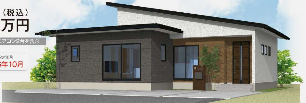
完成イメージです