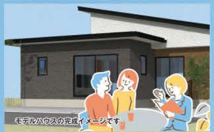
モデルハウスの完成イメージです。