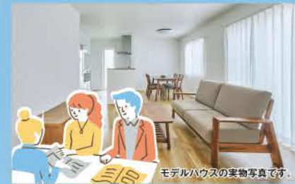
モデルハウスの実物写真です。