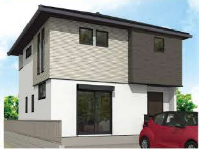
完成イメージです

DATA ■1階床面積/53.82㎡ ■2階床面積/53.57㎡ ■延床面積/107.39㎡(32.48坪) ■敷地面積/165.98㎡(50.20坪)