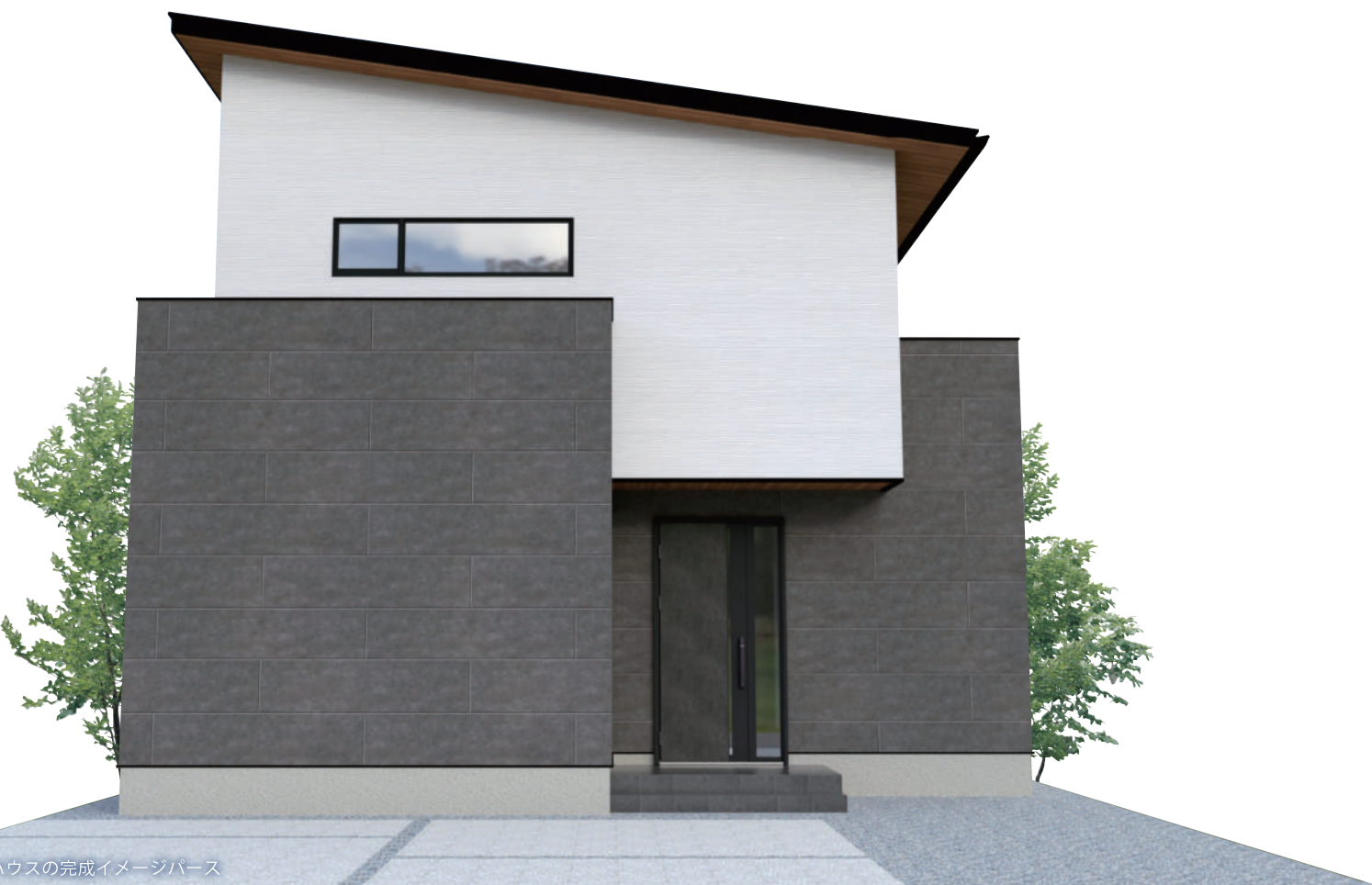
松末モデルハウスの完成イメージパース