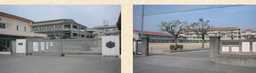
葦高小学校 約800m(徒歩約10分) 新田中学校 約1800m(徒歩約23分)