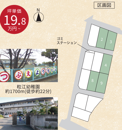
粒江幼稚園 約1700m(徒歩約22分) 粒江小学校 約1400m(徒歩約18分)