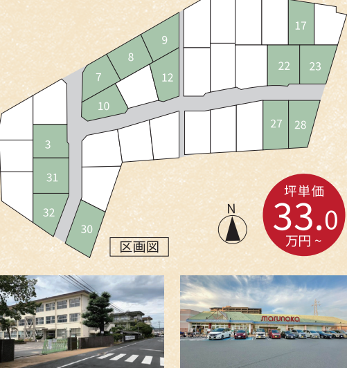
中洲小学校 約600~700m(徒歩約8~9分) マルナカ老松店 約400m(徒歩約5分)