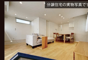
分譲住宅の実物写真です