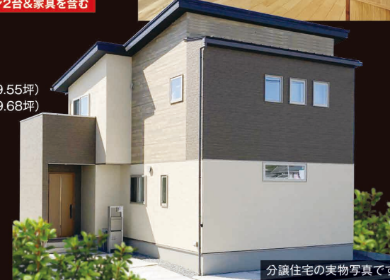
分譲住宅の実物写真です