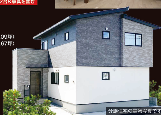
分譲住宅の実物写真です