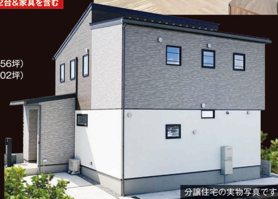
分譲住宅の実物写真です