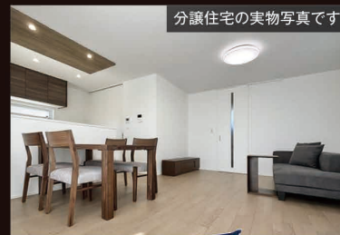
分譲住宅の実物写真です