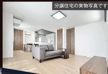
分譲住宅の実物写真です